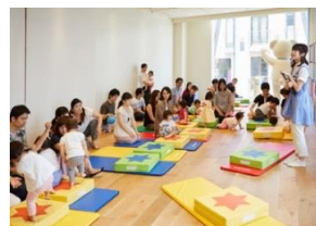
※画像はすべてイメージです