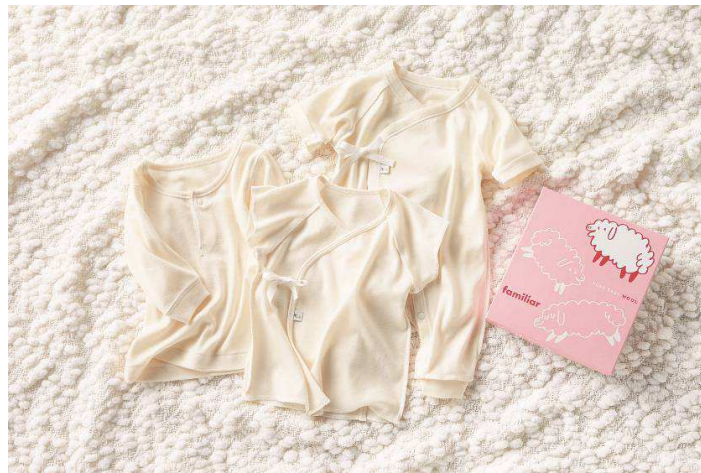
画像は「ピュアベビーウール」 長袖シャツ/打合せ半袖肌着/カバーオール型肌着

ファミリアはこれからも「あかちゃんとママに嬉しい」機能的な商品を展開して参ります。